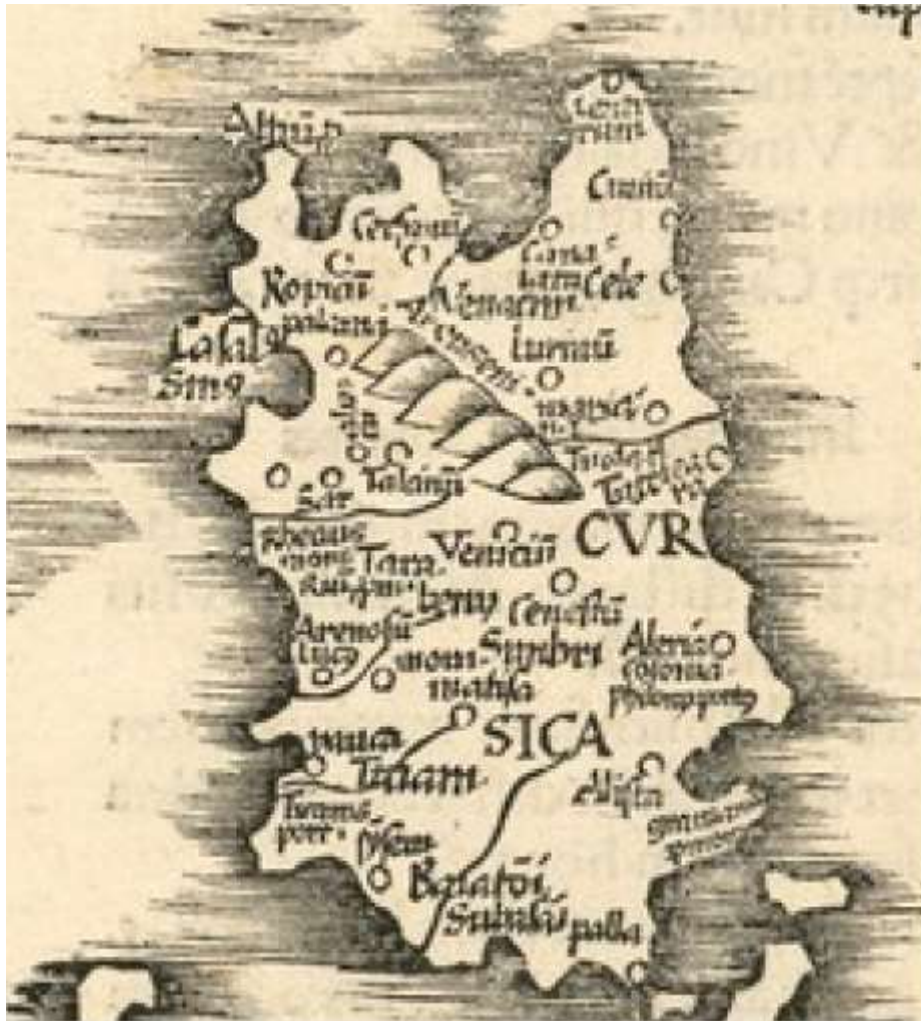
Détail de la carte pour la seule Corse

Europae Tabula VI : Italiam, Cyreneos Insula